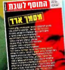
בעקבות חשיפת ידיעות אחרונות

מבקר המדינה יבדוק את טענותיו של ראש המטה לביטחון לאומי לשעבר, ד"ר עוזי ארד, לפיהן לשכת ראש הממשלה צינורה תגובות שהועברו למבקר – כך שיתאימו להנחיותיו של ראש הממשלה בנימין נתניהו. המבקר, מיכה לינדנשטראוס, הודיע אתמול על הבדיקה בתום דיון ארוך שקיימה הוועדה לביקורת המדינה של הכנסת בנושא. הדיון נערך עקב פרסום הרב רים בראיון שהעניק ארד לשמעון שיפר ונחום ברנע ב"ידיעות אחרונות".