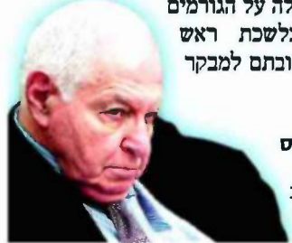
לינדנשטראוס